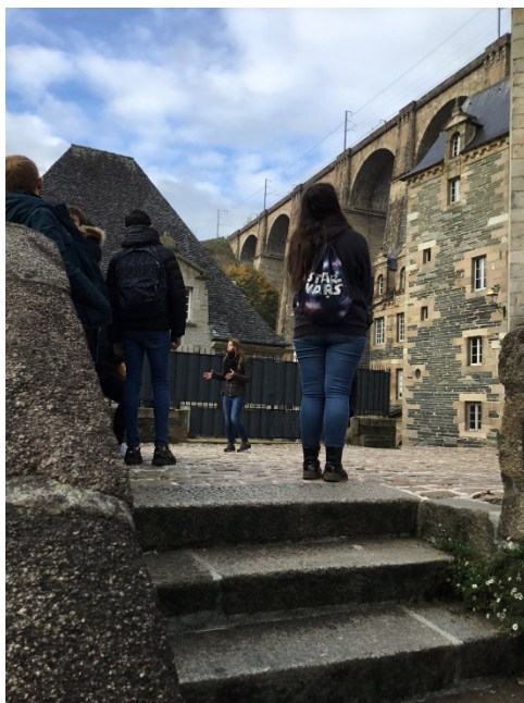
Viaduc de Morlaix

Et pour finir nous nous sommes arrêtés à côté d'une petite église pour regarder le viaduc de Morlaix.