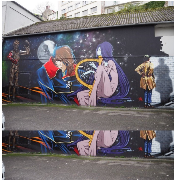
Dessin de plusieurs personnages de fiction