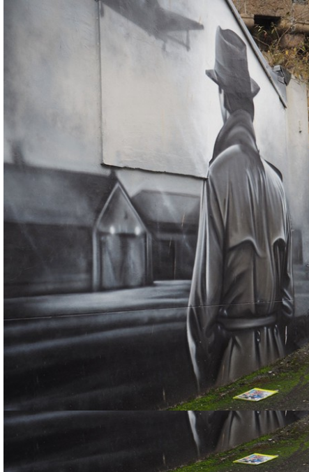
Dessin d'un film

A la sortie du théâtre, une guide nous a rejoints pour nous faire une visite historique de Morlaix. En premier lieu, elle nous a emmenés à côté de deux œuvres peintes sur un deux grands murs différents.