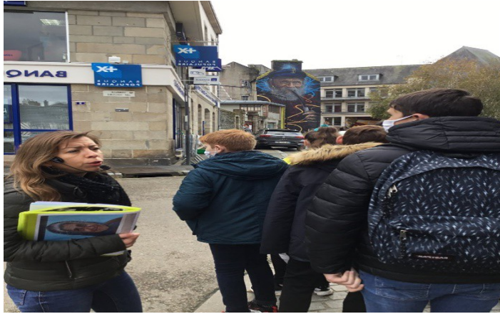
Peinture d'un vieux marin

Et pour finir nous nous sommes arrêtés à côté d'une petite église pour regarder le viaduc de Morlaix.